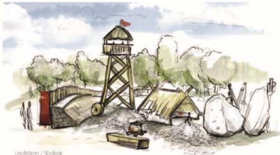
Leuchtturm / Siedlung