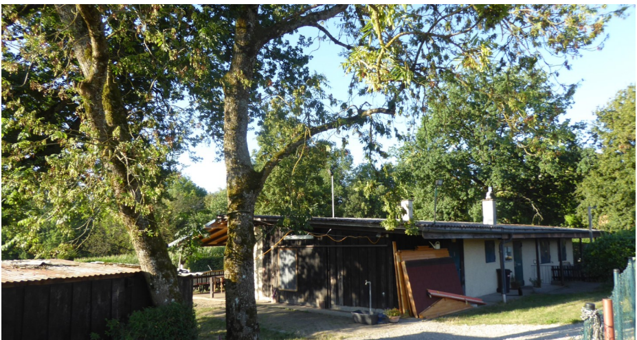
Hundesportplatz Bernseewies