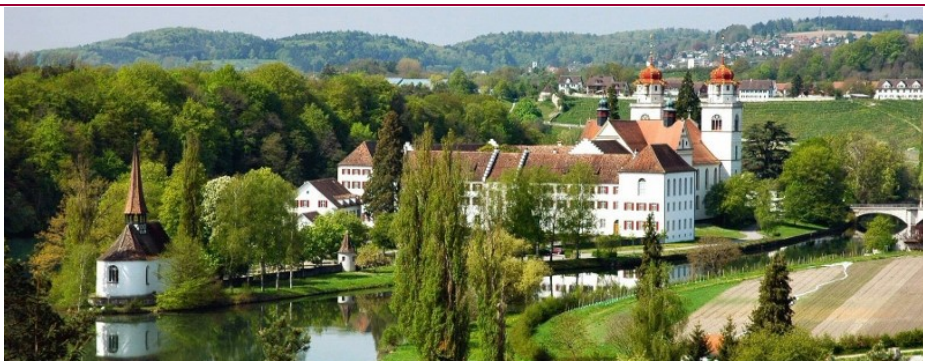
Foto: Archiv Gemeinde Jestetten, Spitzkirche und Kloster Rheinau, CH

Berberaffenkolonie (Fütterung alle zwei Stunden), Baumwipfelpfad, Storchenkolonie, Wasservogelparadies, Dammwildherde und Abenteuerspielplatz.